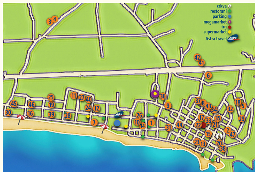
KUĆE U MESTU SARTI: