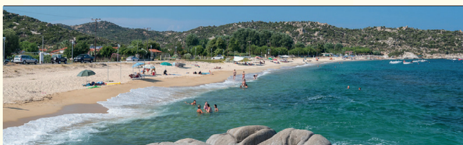
KUĆA GRIAVAS - SYKIA BEACH GPS N40.050633/E23.990085