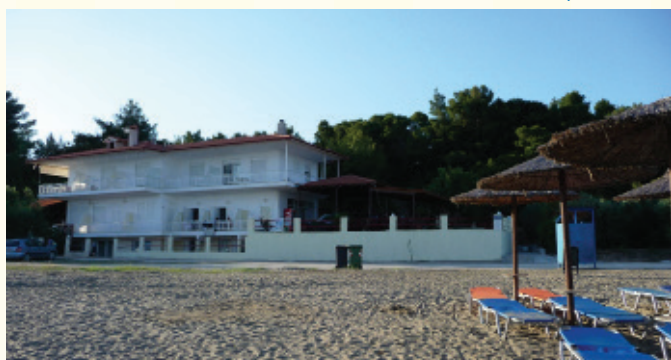
KUĆA ALEXANDRA GPS N 40.259388/E 23.490658

NAPOMENA: Podsećamo Vas da u većini apartmana nema peškira te je potrebno da ih donesete.