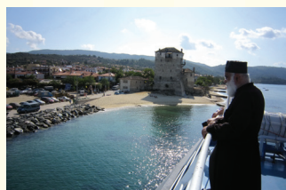
OBILAZAK SVETE GORE

Tokom Vašeg boravka biće organizovani fakultativni izleti, o rasporedu se možete informisati kod predstavnika ili putem oglasnih tabli koje se nalaze u Vašim kućama.