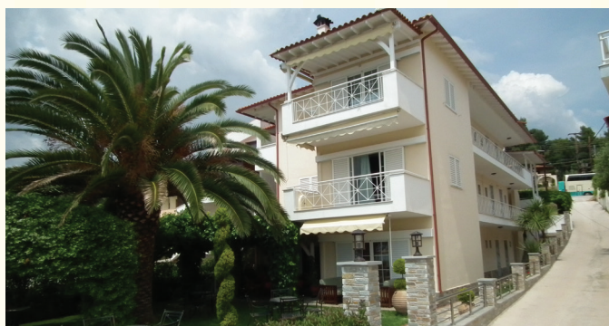
KUĆA PORTO PSAKOUDIA GPS N40.25943/E23.48847

Tokom Vašeg boravka predstavnik će dolaziti u obilazak gostiju 2-3 puta u toku smene. Za sve informacije se možete u svakom trenutku obratiti na telefon call centra: 0030 693 481 0198