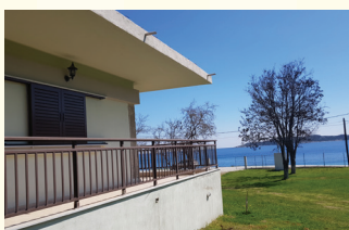
KUĆA GRIAVAS - SYKIA BEACH GPS N40.050633/E23.990085

ŽELIMO VAM SREĆAN PUT I PRIJATAN BORAVAK!!!