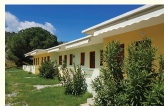
BUNGALOVİ MARIA - VALTI BEACH GPS N40.051825/E23.997377